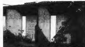
Appartamenti San Giuliano Milanese Costituzione 4, Via F.lli Rizzi